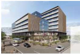
【新庁舎外観イメージ】

今年度末に向け実施設計が行われていますが、市は「パブリックコメントは行わない」と答弁しました。