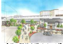
【西口駅前広場イメージ】