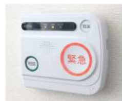
【緊急通報装置イメージ】

固定型・携帯型の2種類で選べるようになり、買取方式からリース方式となりました。費用負担も所得に応じて月額0円～1200円となりました。