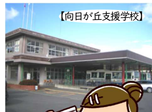
【向日が丘支援学校】