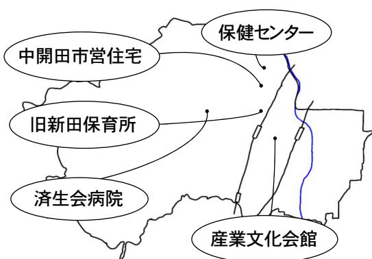
【再編や移転となる施設の例】

市内の87の公共施設の「再編整備構想」が出されていますが、市民に広く知られていません。施設移転後の跡地に何をつくるかも「構想」に書かれておらず、市民の願いが反映される仕組みになっていません。